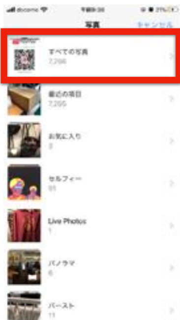
【すべての写真をタップ】