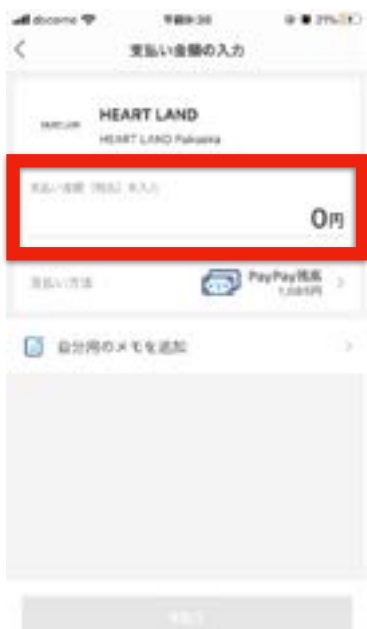
【"お支払い金額"をタップ】