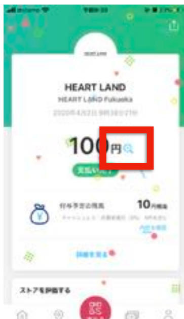
【金額横の"虫眼鏡"をタップ】