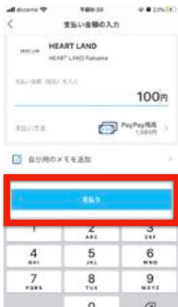
【金額を入力し、"支払う"をタップ】