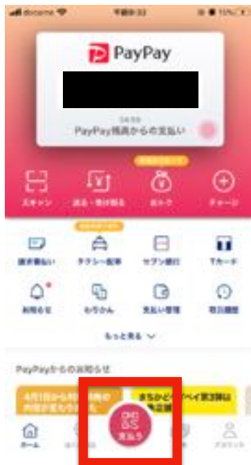
【アプリで"支払う"をタップ】