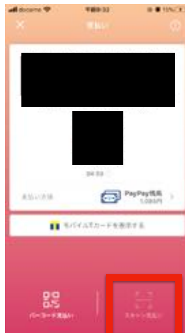
【"スキャン支払い"をタップ】