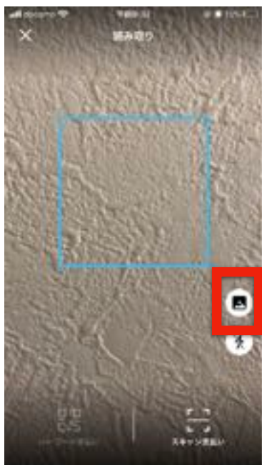
【"山のマーク"のアイコンをタップ】